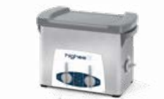
Highea 3 LAVAGGIO