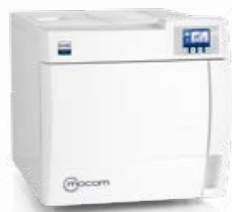
B Classic AUTOCLAVI