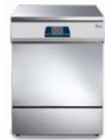
Tethys T60 - Tethys D60