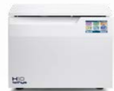
Tethys H10 plus TERMIDISINFEZIONE