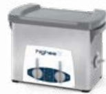
Highea 3 LAVAGGIO