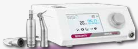
IMPLA-ONE CON CONTRANGOLO 20:1 Micromotore implantare