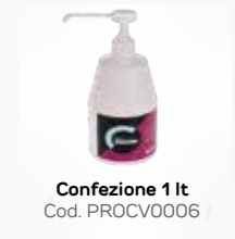
Confezione 1 lt Cod. PROCV0006