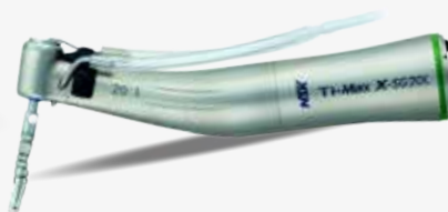
CONTRANGOLO X SERIES XSG20L F.O 20:1 Manipolo chirurgico per implantologia a fibre ottiche