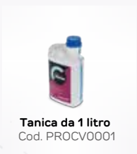
Tanica da 1 litro Cod. PROCV0001

Sapone delicato per il lavaggio frequente delle mani. Contiene agenti idratanti per proteggere la pelle dagli effetti essiccanti dell'acqua. Eccellente tolleranza cutanea. Adatto alle pelli sensibili.