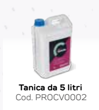
Tanica da 5 litri Cod. PROCV0002